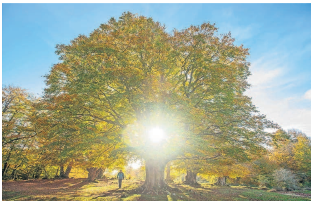
Un hayedo en Urbasa (Navarra) y, abajo, la escultura Figurita entre dos casas , de Giacometti, en el Guggenheim de Bilbao.

La gran retrospectiva sobre Alberto Giacometti (1901-1966) que acaba de inaugurar el museo Guggenheim Bilbao (hasta el 24 de fe-