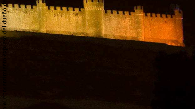
Fotografía nocturna del Castillo de Peñafiel iluminado con motivo de su décimo aniversario como sede del Museo Provincial del Vino. La fortaleza se ha convertido en todo un emblema del enoturismo para la comarca.