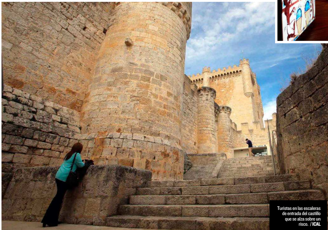
Turistas en las escaleras de entrada del castillo que se alza sobre un risco.

sión a este coqueta abadía del siglo XII que en su refectorio acoge la cocina de Marc Segarra, con estrella Michelin. La elegancia y la exclusividad se ha apoderado en el tiempo de esta comarca donde es difícil elegir donde comer y