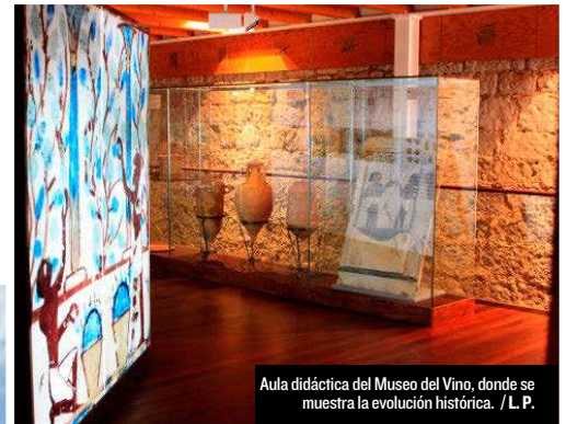
Aula didáctica del Museo del Vino, donde se muestra la evolución histórica.

De 11 a 20 horas. Feria Alimentos de Valladolid. Parque de la Judería. 13 horas. Concierto Vermouth. Plaza de España. Grupo Langosta. 19 horas. Grupos de Danza Tradicional. Plaza de España. * Habrá autobuses de Valladolid con reserva previa de lunes a viernes de 9 a 14 h. Precio: 5€/ persona. Teléfono: 983 427 174.