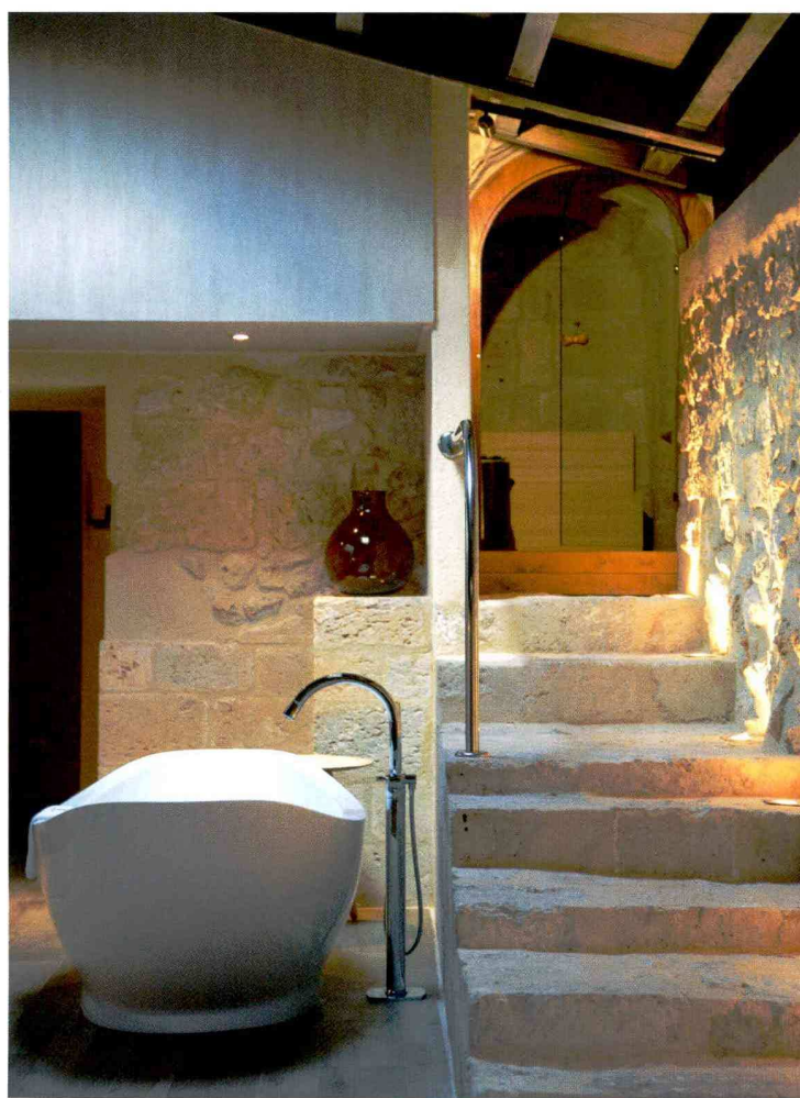
Sobre estas líneas, piscina y patio del hotel Monasterio de Valbuena, uno de los alojamientos pertenecientes a la cadena de balnearios Castilla Termal. A la izda., una de sus habitaciones.

¿QUÉ HAY DE NUEVO? Castilla Termal ofrece beauty parties con o sin alojamiento: masajes, tratamientos y el beneficio de las aguas minero-medicinales de sus balnearios. Además, cenas con menú especial en comedores privados. ISABEL EDROSO