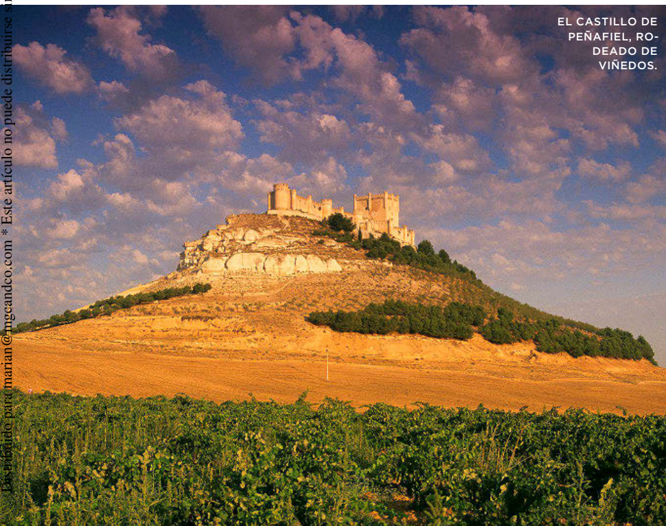
EL CASTILLO DE PEÑAFIEL, RODEADO DE VIÑEDOS.

Peñafiel es también sede de las famosas Bodegas Protos . Construidas en 1927, fueron de las primeras de la D.O. de la Ribera del Duero. Situada a los pies del Castillo, la visita guiada incluye sus instalaciones –la antigua que recorre el interior de la montaña y la nueva de diseño– y una degustación de sus vinos (precio: 10 €. Reservas: www.bodegasprotos.com y ☎ 659 843 463). A las afueras de Peñafiel, a unos 4 km, en Padilla de Duero, se encuentra la moderna Resalte de Peñafiel (comenza-