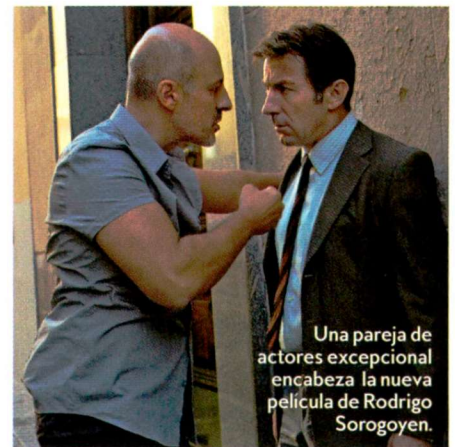
Una pareja de actores excepcional encabeza la nueva película de Rodrigo Sorogoyen.

Las peripecias de Francisco Paesa y, por ende, las de Luis Roldán, llegan al cine de la mano de Eduard Fernández, Carlos Santos y Marta Etura. Corrupción y estafas en la crónica de una venganza anunciada.