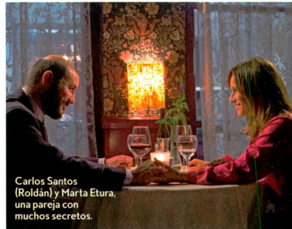
Carlos Santos (Roldán) y Marta Etura, una pareja con muchos secretos.