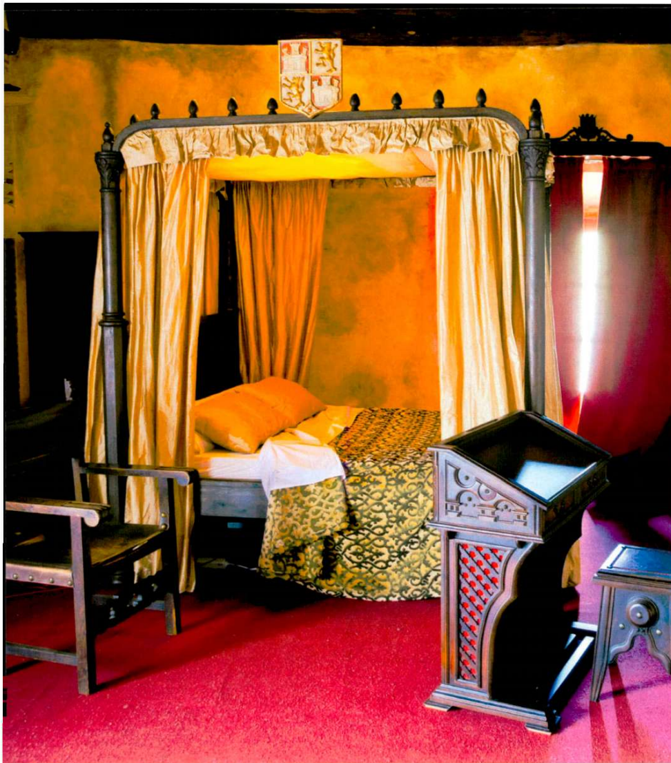
Mandado construir por los Reyes Católicos, el Palacio Testamentario fue testigo de muchos de los importantes acontecimientos históricos que tuvieron lugar en Medina del Campo. En él además de dictar su testamento, falleció la Reina Isabel la Católica en el año 1504. Sus salas permiten descubrir a este importante personaje histórico y conocer mejor su época.